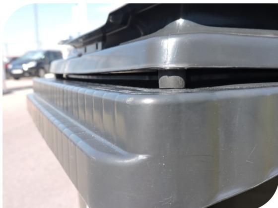
Tope de goma en la tapa