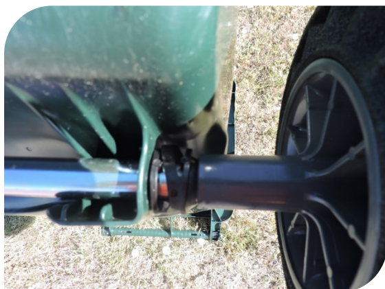
Ruedas insonorizadas mediante compensador