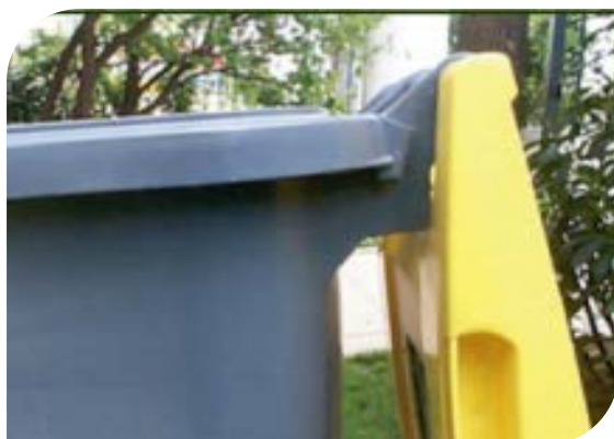
Amortiguación de apertura de la tapa